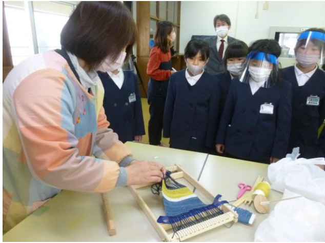
出来たら糸のまとめ方を指導