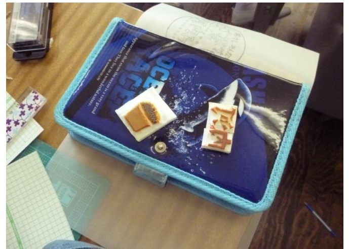
消しゴム版画のゴムが完成しました