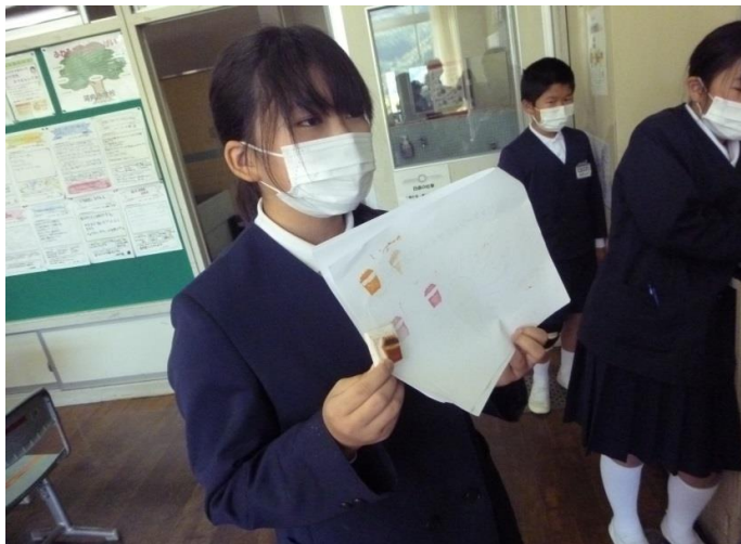
これに決めました