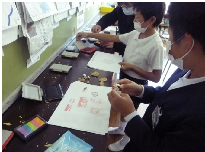
シャチハタスタンプで押してみました